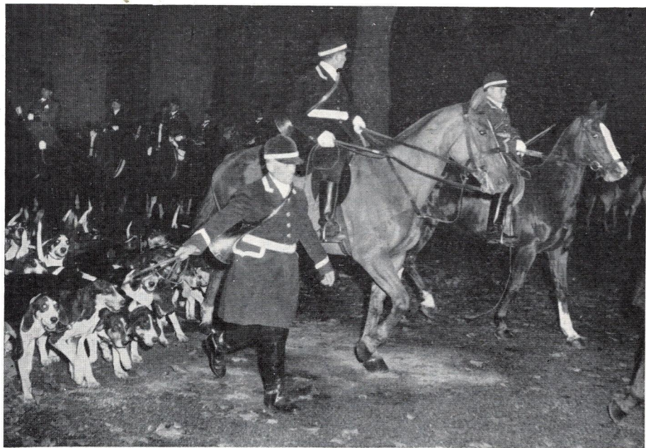
Le défilé au cours de la représentation dans le parc de l'exposition de Dusseldorf.

Maintenant avec les chiens... ça c'est autre chose. Cent chiens en liberté que les piqueux ne connaissent que depuis l'avant-veille! Un beau découpler... un magnifique laisser-courre! Laisser courir plutôt! Un éparpillement bruyant, à croire qu'on ne les reverrait plus! Mais il n'est pas de bonne fête qui n'ait une fin, même chez les chiens. On les rattrape, on les couple, on sépare les deux meutes, on les encadre comme on peut d'abord, ensuite dans l'ordre prévu. Quatre fois on refait la manœuvre jusqu'à exécution parfaite. Il est 2 heures; on retourne en ville pour déjeuner, après quoi on va examiner le parcours du soir. Il était assez long, et il fallait traverser une grande artère de la ville entre la descente du camion et le local de l'exposition. Nous demandons à la police d'interrompre la circulation pour notre passage, ce qui est accordé immédiatement.